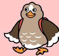
大崎市公式キャラクター バタ崎さん