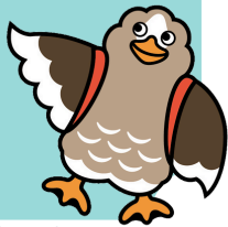
大崎市公式キャラクター ピコ山崎さん

悩みや不安を抱えている児童生徒や保護者の気持ちを大切にし、気持ちを和らげるようなお手伝いのできたらと考えています。