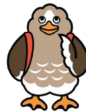
大崎市公式キャラクター パタ崎さん