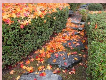
彩りの美しい紅葉、黄葉

立冬が過ぎ、冬紅葉（紅葉の終わり頃に数は少ないが更に濃く透き通るように残った紅葉）が見られる頃には、庭園も来るべき寒さに備えて、冬支度が始まります