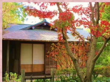
鮮やかに色づく紅葉