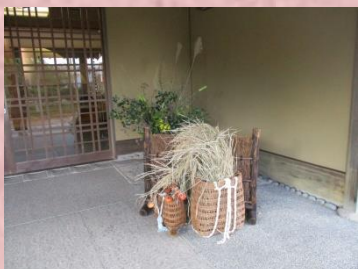
五穀の収穫に感謝