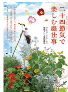
ひきちガーデンサービス／著 築地書館／出版 (629.75ニジ)

二十四節気では、「一年のはじまりは立春から」とされています。 冬の寒さもやわらいて、生きものの達が春の支度をはじめの頃です。うぐいすが春の訪れを告げ、梅の花は咲きほころび、芳香を放ちます。 暦上では春のはじまりですが、まだまだ寒い時期です。桜餅やうぐいす餅、旬の野菜や山菜を楽しみに、春のあたたかな足音が聞こえてくるのを待つこの頃です。