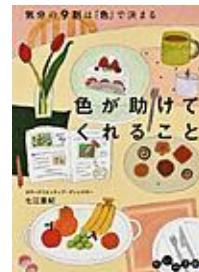
七江 亜紀／著 大和書房／出版 (B146.8ナナ)

心や身体が疲れている時に、図書館でお気に入りの本を見つけてリフレッシュしてみませんか？