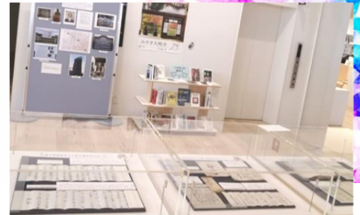
企画：大崎市教育委員会 文化財課

今回の展示では、大崎市へ寄贈頂いた永澤家文書の中から、古川の水道事業開始に関する貴重な史料を紹介いたします。展示期間は1月下旬～4月17日までを予定しています。（場所：1階エレベーター前付近）