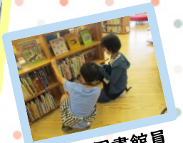
子ども図書館員 体験!返ってき た本をきちんと 元の場所に戻せ ました!