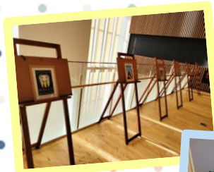
心温まるポストカード をいただきました! ご自由にお持ち帰り 下さい!

「大野隆司作品展」と「特設撮影スポット」は、 8月28日(日)まで開催しております!