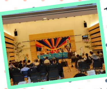
郷土芸能の神楽や謡曲! 凛とした身のこなしがとても かっこよかったですね!

大崎市図書館5周年記念事業として、7月16日～7月18日の3日間に図書館まつりを行いました。今年はよりたくさんの方々にご参加いただき、誠にありがとうございました!