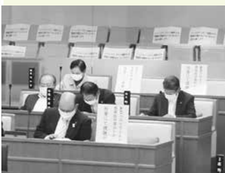
3密対策で、約半数が議場外で傍聴し、まばらになった議場の様子