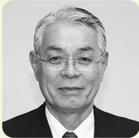
30 おお やま いわお 大 山 巖 (2期)