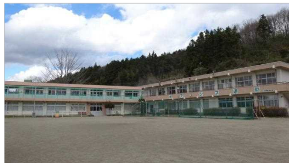
校舎等の外観写真