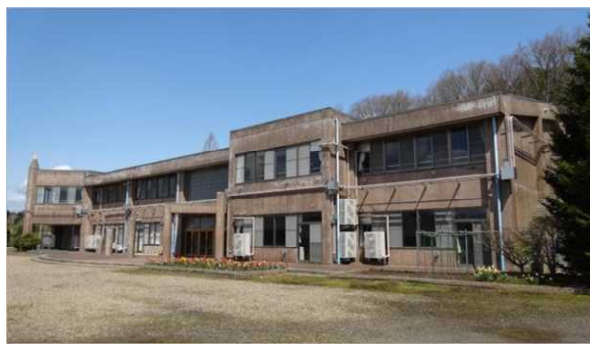
校舎等の外観写真