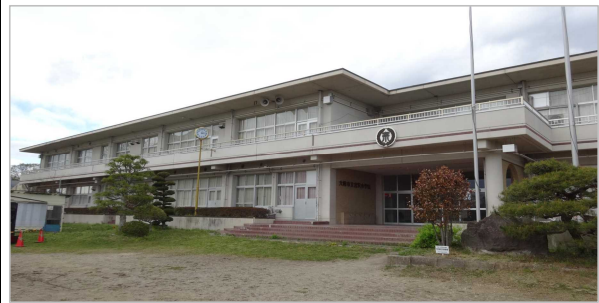
校舎等の外観写真