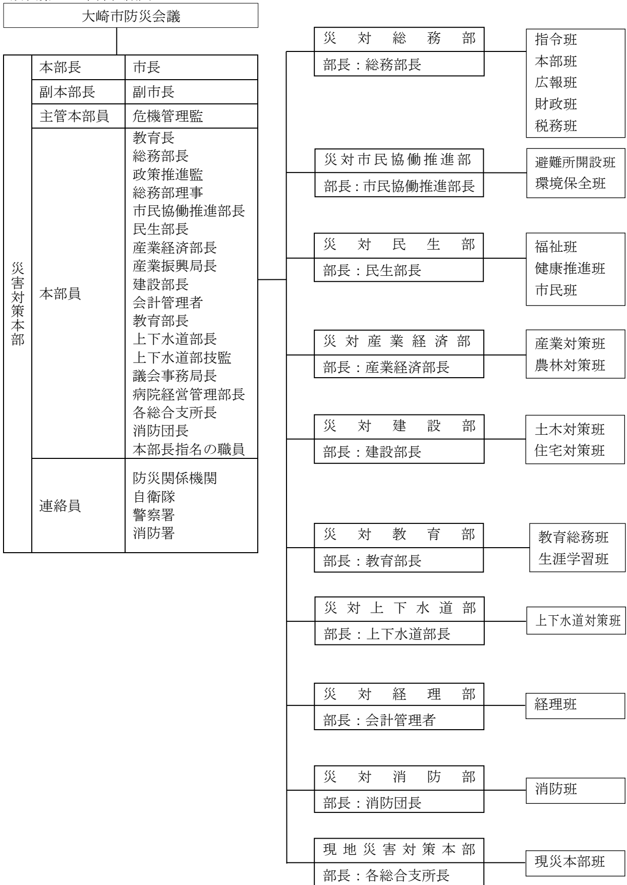
別表第 1 本部組織図